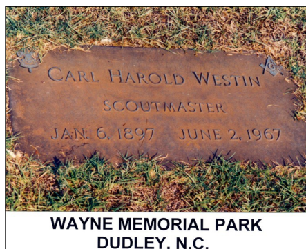
WAYNE MEMORIAL PARK DUDLEY, N.C.

Begravningsakten skedde i den presbyterianska kyrkan i Goldsboro och han begravdes på Wayne kyrkogård i Dudley, North Carolina. I kyrkan fyllde hans scouter i sina uniformer de främsta raderna och alla hans vänner raderna bakom dem.